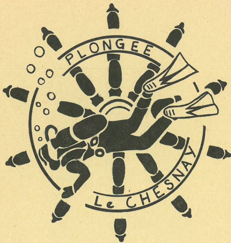
TABLE AU ACCIDENTS de PLONGÉE